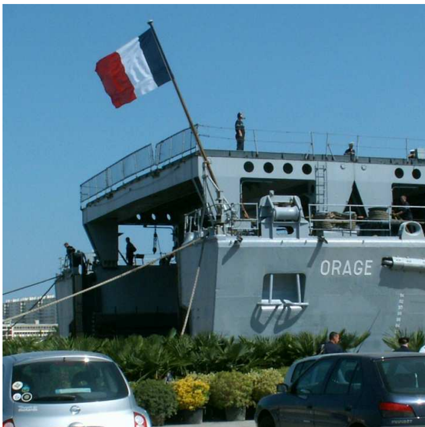
Mat de pavillon en place, le 29 juin 2007 Toulon