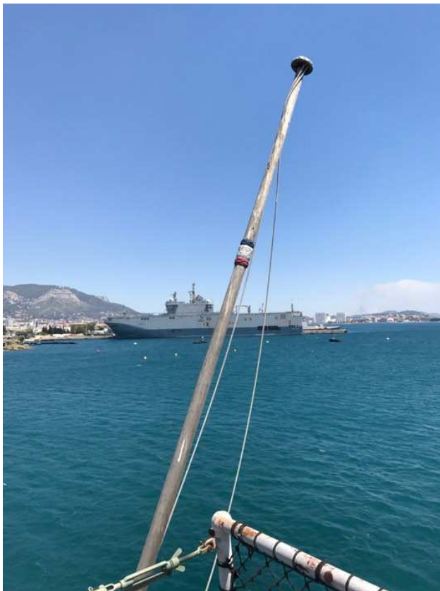
Mat de pavillon le jour de sa récupération fin juillet 2017 – Toulon