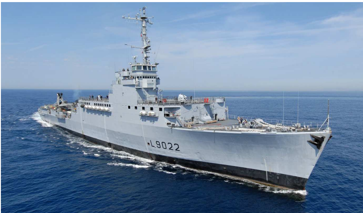
le 29 juin 2007, lors de la dernière sortie en mer

Programme en cours de mise au point ... et qui devrait rappeler des souvenirs à tous !