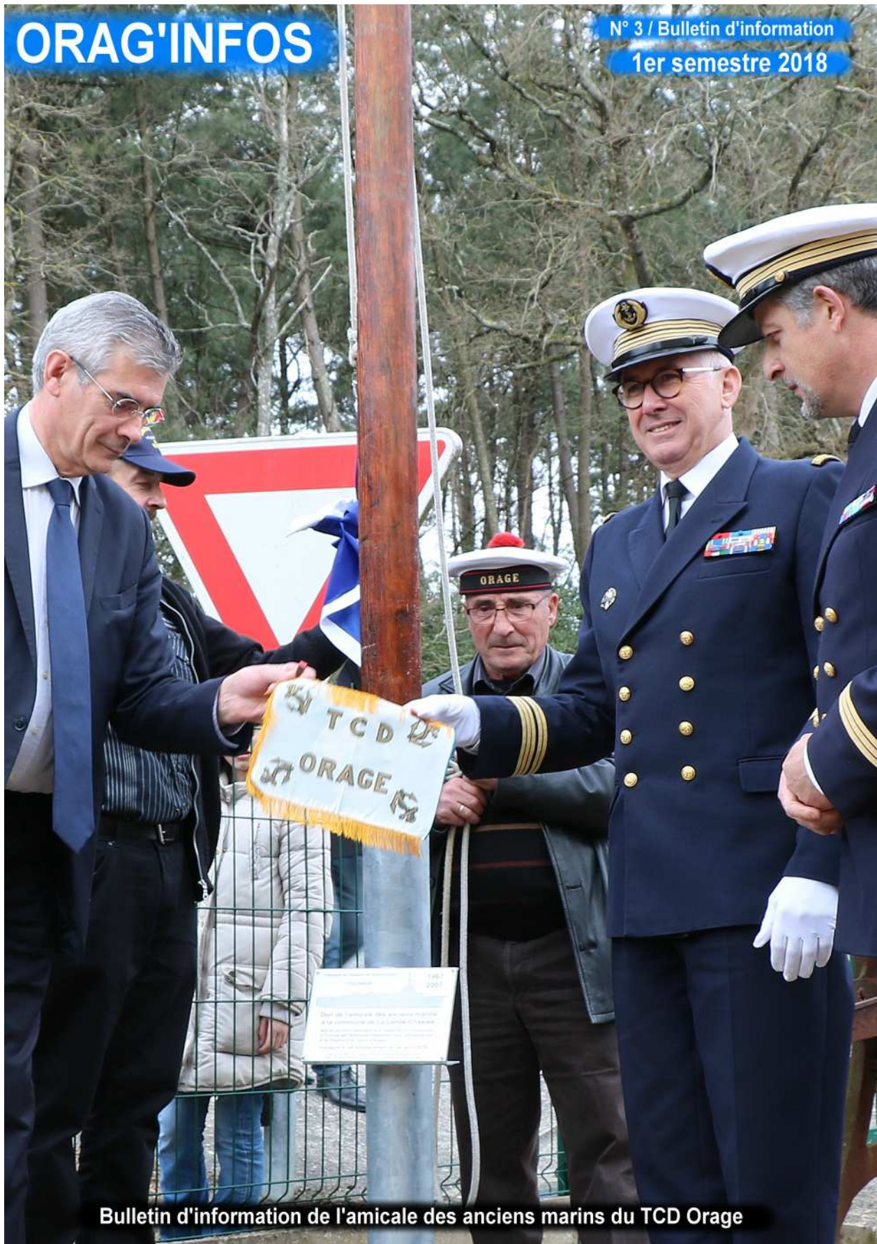
Bulletin d'information de l'amicale des anciens marins du TCD Orage