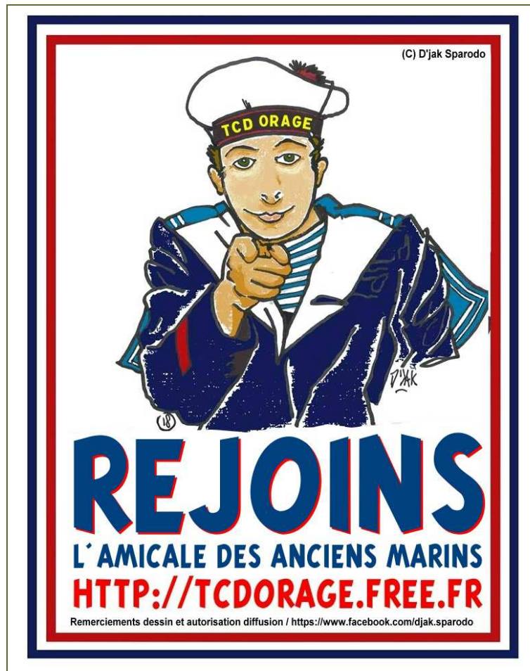
Affiche promotion amicale !

Nul marin ne peut prétendre N'avoir point aimé et chéri Ce bateau, qu'il a su comprendre ; À qui il a confié sa vie.