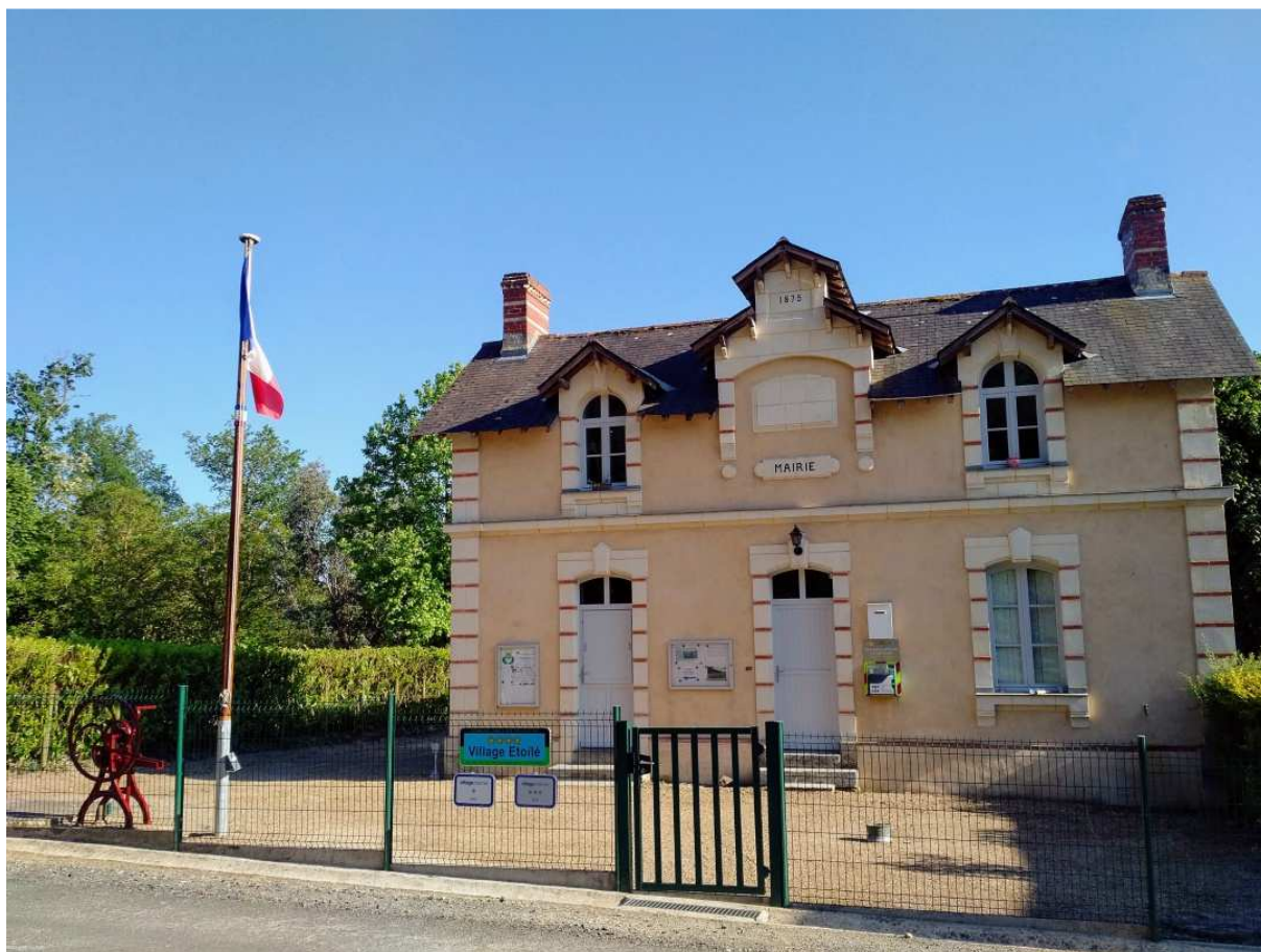
Plaque au pied du mat, inaugurée le 1er avril 2018