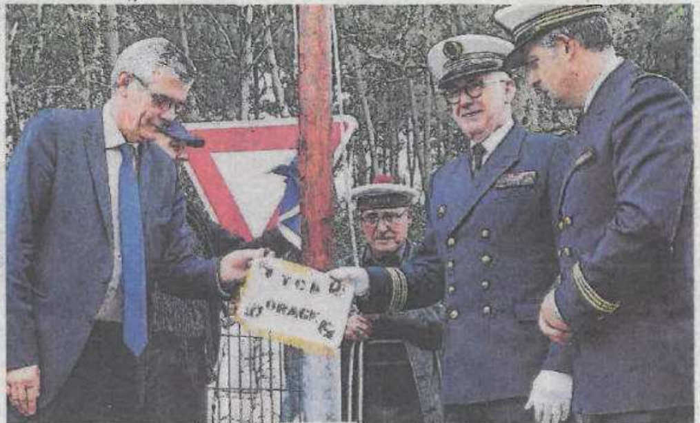
La plaque a été dévoilée devant le mât implanté près de la mairie, par les élus et les anciens marins du TCD Orage.

La veille de son départ, le mât a été récupéré par le Groupe des Bâtiments Désarmés, puis transporté jusqu'à La Lande-Chasles par le 6 e Régiment du Génie d'Angers. Une opération de sauvegarde du patri-