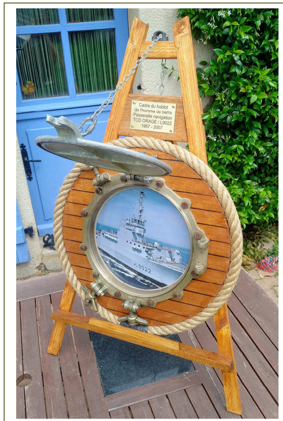
Un travail exceptionnel !

Encore merci à tous ceux qui ont contribué à ce succès. Il vous reste à venir le contempler à La Lande Chasles (49).