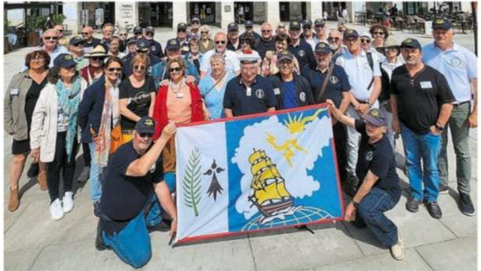
Les membres du TCD Orage ont posé avec le drapeau devant la mairie de Bayonne.