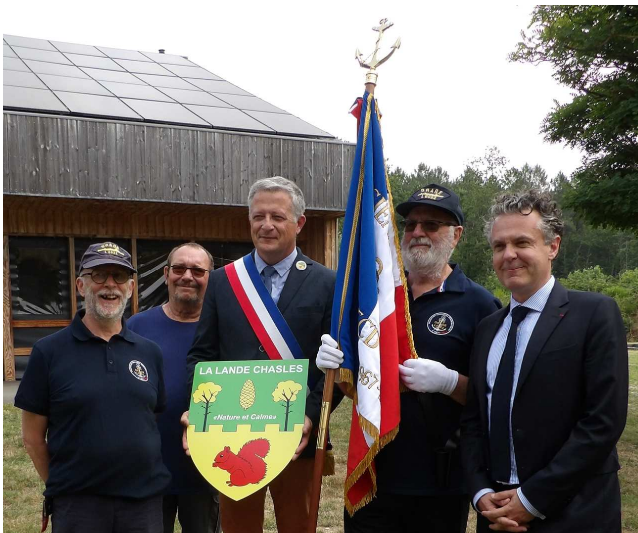
Photo souvenir avec le Ministre Christophe Béchu