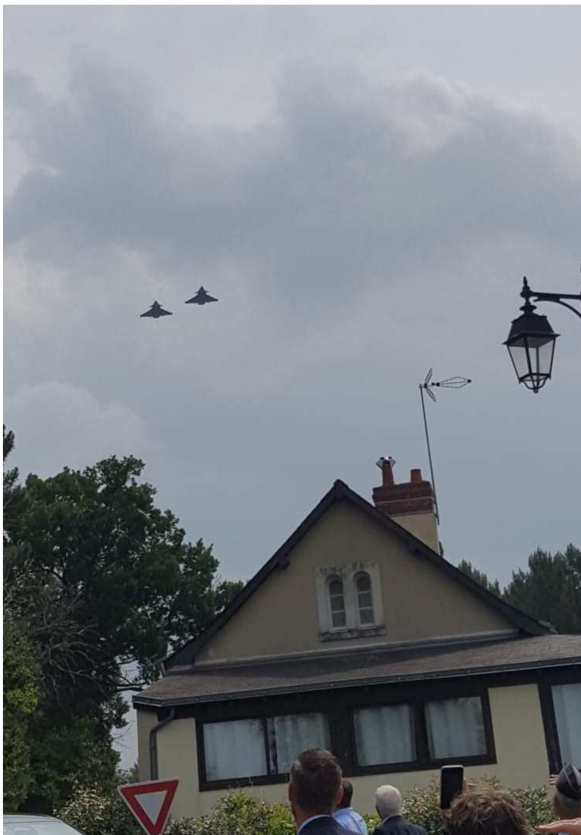
12h précise, passage des 2 Rafales Marine

Anniversaire fêté à La Lande-Chasles avec la présence d'un ministre et le survol du siège social de la commune par 2 Rafales de la Marine Nationale (11F) en présence des deux porte-drapeaux de l'amicale et un membre