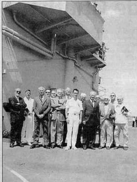
Les anciens réunis pour la dernière sortie de L'Orage.