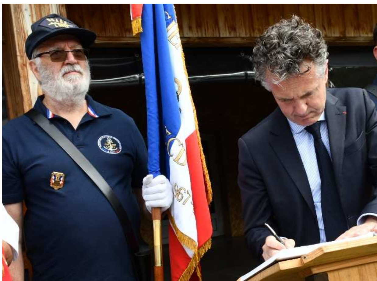
Et à côté du Ministre lors de la signature du Livre d'or