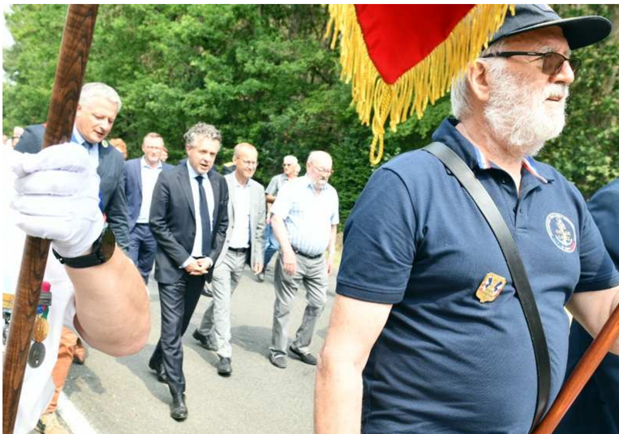
Le porte-drapeau de l'amicale en tête de cortège ministériel