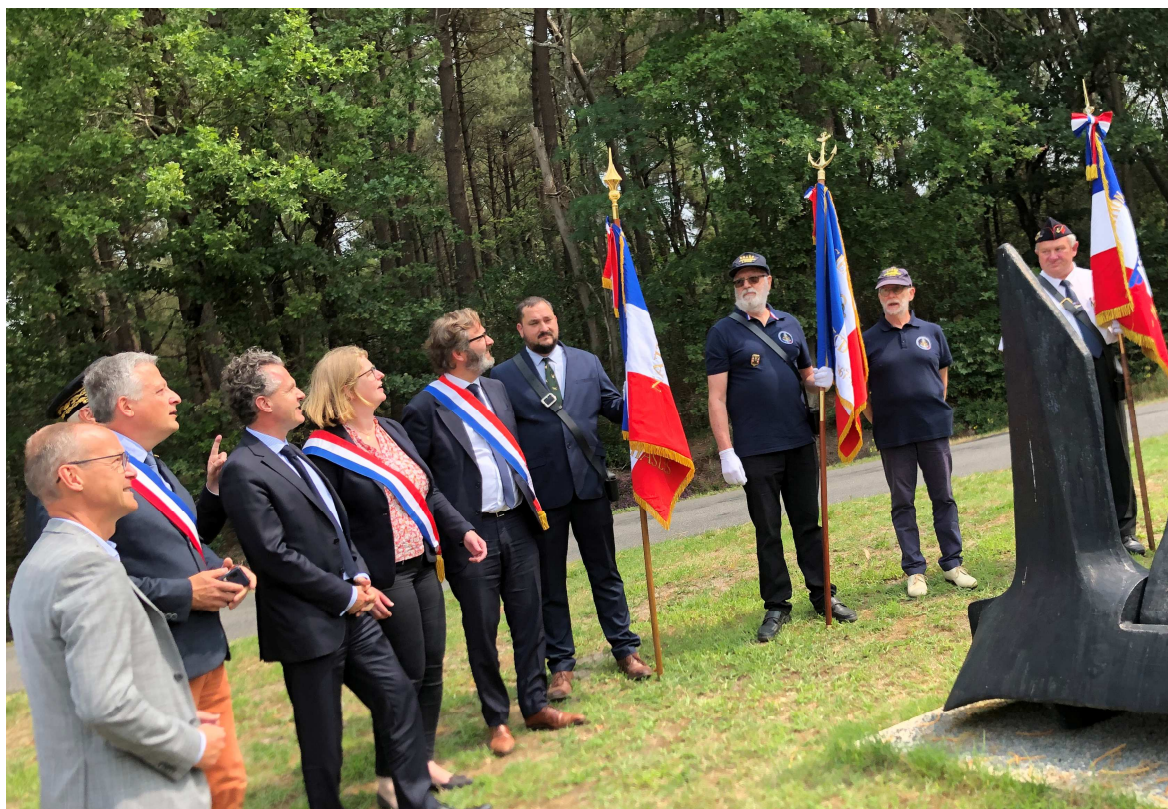
Passage des avions en présence de deux sénateurs et une députée